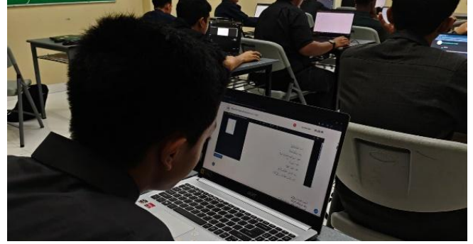
صورة 4: عملية التقويم في مادة اللغة العربية

التقويم إلى رسمي وغير رسمي، مع تنوع في أشكال التقييم بين التحريري والشفوي والمشروعات. كما أن استخدام تطبيق "مدرستي" يساهم في تسهيل إدارة نتائج التعلم وحفظها بطريقة آمنة.