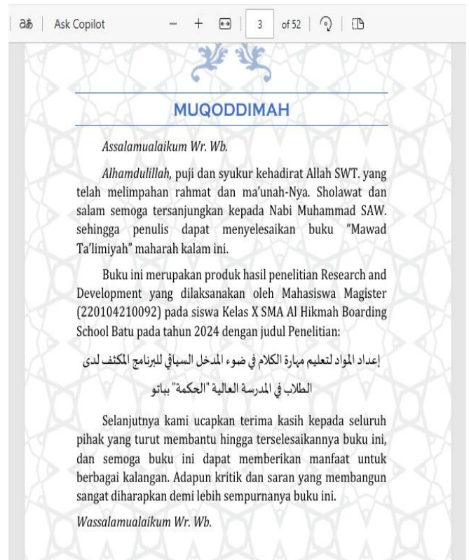
صورة 1: الكتاب المستخدمة في تعليم اللغة العربية