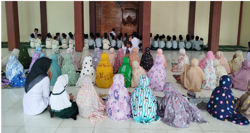
Gambar 1. Kegiatan Shalat Duha Sebelum Jam Pelajaran Dimulai

Berdasarkan data wawancara tersebut, integrasi antara pembiasaan sehari-hari dan keteladanan guru menciptakan efek sinergis dalam pembentukan karakter siswa. Pembiasaan membangun disiplin dan rutinitas perilaku, sedangkan keteladanan menyediakan model nyata yang dapat ditiru siswa. Gabungan kedua pendekatan ini menghasilkan perkembangan karakter yang menyeluruh, meliputi disiplin, tanggung jawab, kepedulian sosial, empati, kerja sama, dan percaya diri. Hasil ini menegaskan bahwa pembentukan karakter siswa tidak hanya bergantung pada instruksi verbal atau aturan, tetapi membutuhkan pengalaman nyata melalui praktik sehari-hari dan teladan yang konsisten dari guru serta lingkungan sekolah. Yang didukung oleh data observasi dan dokumentasi pembiasaan shalat duha sebelum jam pelajaran dimulai sebagaimana gambar berikut: