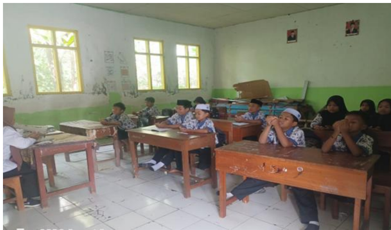
Gambar 1. Pembacaan Doa Pembuka Pembelajaran

Strategi ini memungkinkan siswa dapat melihat dan mendengar langsung contoh cara pelafalan sehingga pada akhirnya mereka bisa melakukan hal serupa. Secara teori, hal tersebut menunjukkan bahwa guru selain sebagai pendidik sekaligus sebagai teladan utama bagi siswa dalam melakukan hal-hal positif terutama berkaitan dengan hal ibadah.